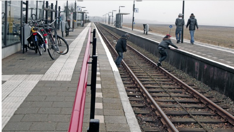
De volgende weken wordt er intensief gecontroleerd. Er zullen zware boetes uitgeschreven worden.

Agenten in burger controleren aan 89 overwegen